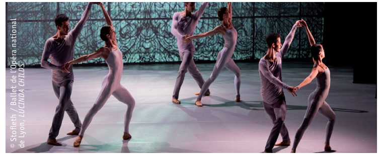
© Stollieth / Ballet de l'Opéra national de Lyon, LUCINDA CHILDS