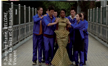
© Jumping Frame / WELCOME, Pierre Larauza et Emmanuelle Vincent