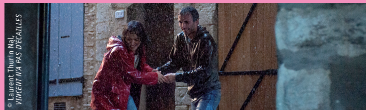
© Laurent Thurin Naï, VINCENT N'A PAS DE CAILLLES